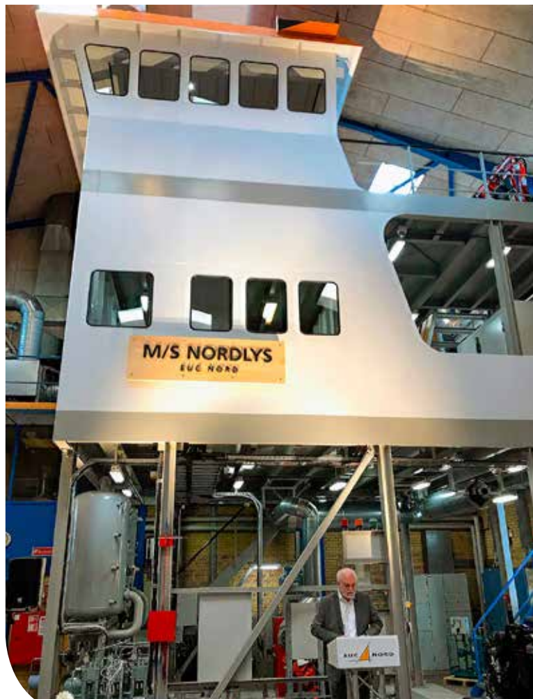
M/S Nordlys består af styrehus, teknik-dæk og nederst maskinrum. Hvert dæk er rigt udstyret med alt tilhørende og dermed har EUC Nord skabt et autentisk læringsmiljø.

I styrehuset kunne jeg genkalde mig tidligere tiders tålmodig venten på klarmelding fra etagerne under. Trygt vidende, at der kompetent blev arbejdet på at få skibet sejlklar så hurtigt som muligt. Indrømmet, jeg har ikke altid evnet at holde mig tålmodigt på øverste etage og har været 'i kælderen' og givet en hånd med ved løbende at klare op under arbejdet.