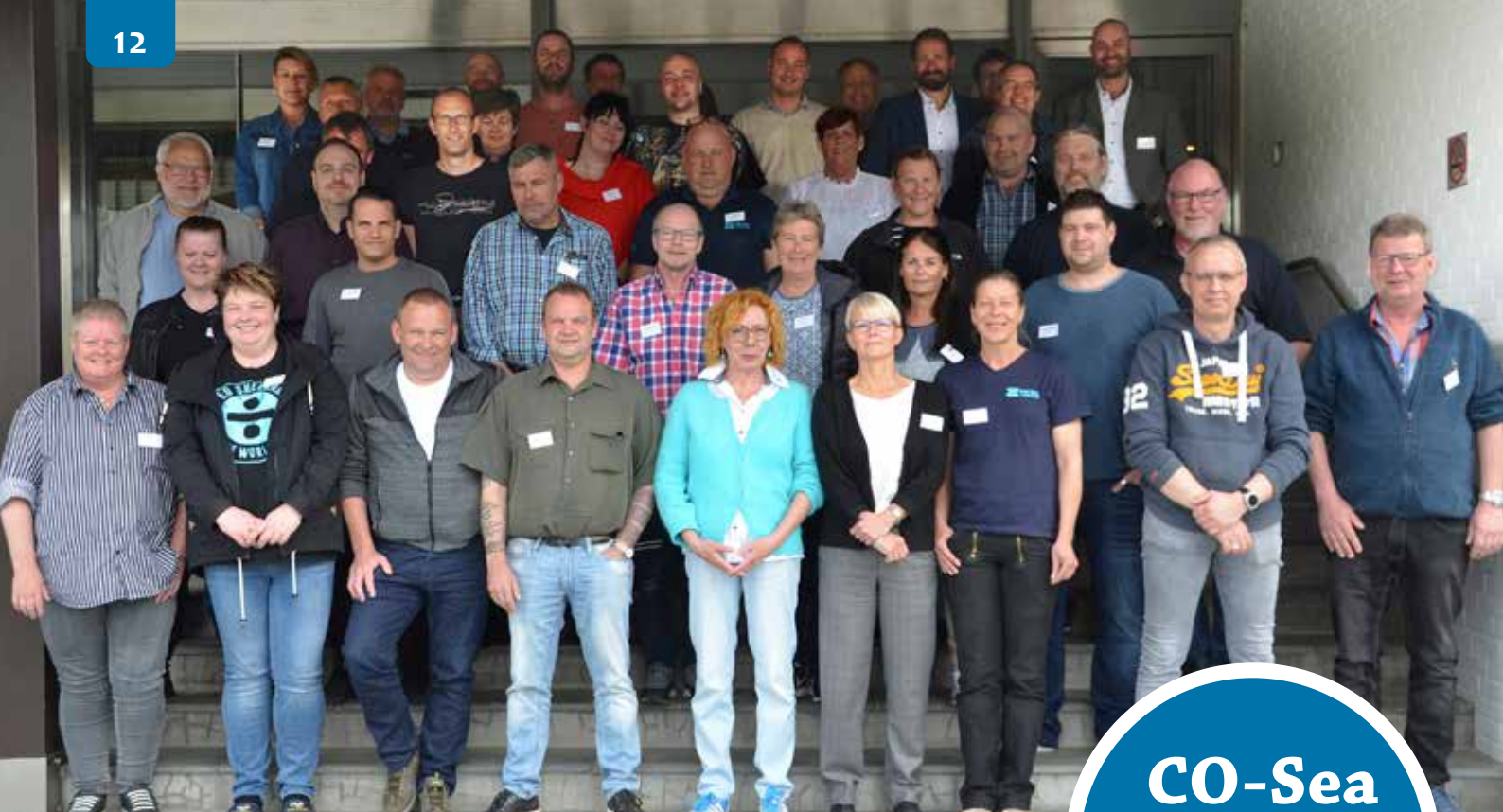
Det er ikke tilfældigt, at seminardeltagerne på gruppefotoet i år ser ualmindeligt friske ud. Billedet er nemlig taget på førstedagen, få timer efter start på det tre-dages seminar, der som vanligt blev afholdt på Metalskolen i Jørlunde.